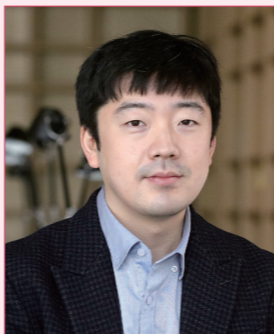
윤창교 세계보건기구 서태평양사무처 질병통제국 기술자문관